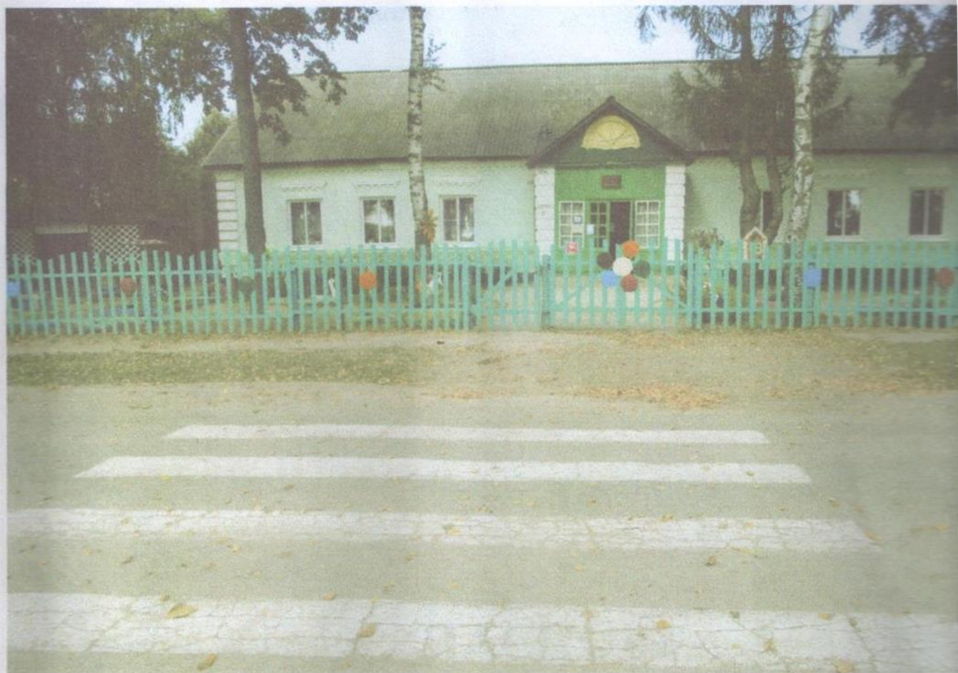
Фото разметки дорожного перехода и дорожных знаков «Пешеходный переход», «Осторожно, дети!»